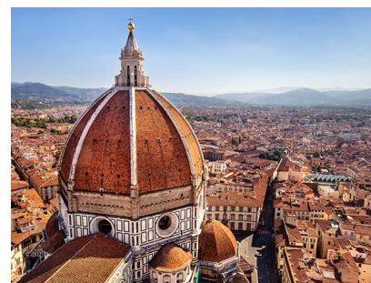
サンタ・マリ ア・デル・フィ オーレ大聖堂→